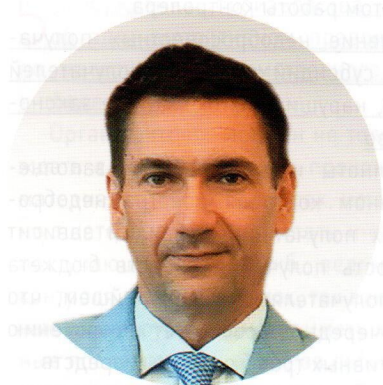
Александр Михайлович ЖУКОВ, председатель Комитета государственного финансового контроля Санкт-Петербурга