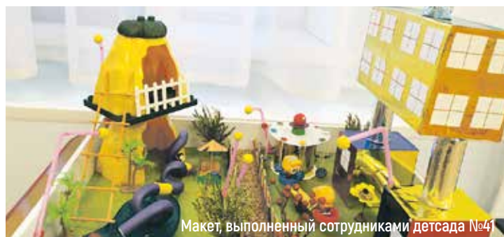
Макет, выполненный сотрудниками детсада №4

Прошел конкурс «Красное Село: вчера, сегодня, завтра».