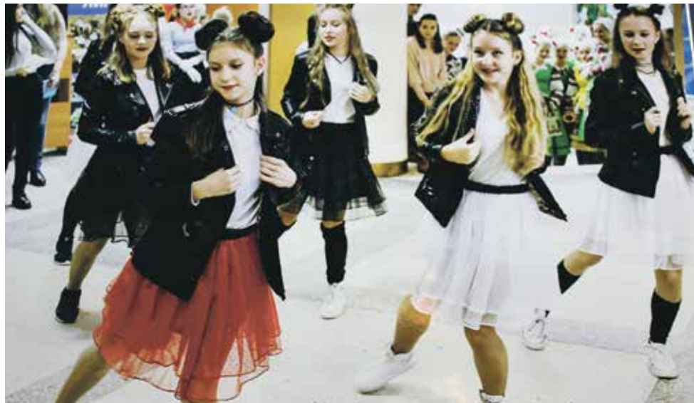
«Кто, если не мы – молодые!» – лейтмотив слета молодежи Красносельского района

Общественные организации района ведут работу по вовлечению населения в общественную жизнь,