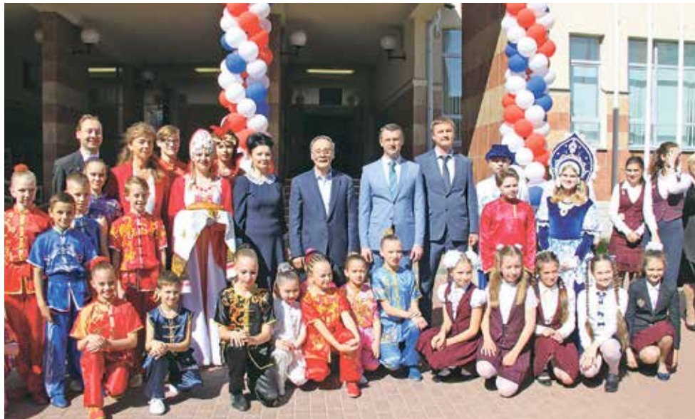
Делегация КНР в гостях у учеников школы № 547

С 14 по 17 марта в Центре физической культуры, спорта и здоровья Красносельского района прошел X открытый турнир по боксу среди юношей на призы чемпиона мира по боксу среди профессионалов в супертяжелом весе Николая Валуева. На соревнованиях приехали 134 спортсмена в составе 34 команд из Санкт-Петербурга, регионов России, дальнего и ближнего зарубежья. С 27 по 29 марта в Детской школе искусств проходил V Международный детский конкурс электроакустической музыки «Электронная палитра».