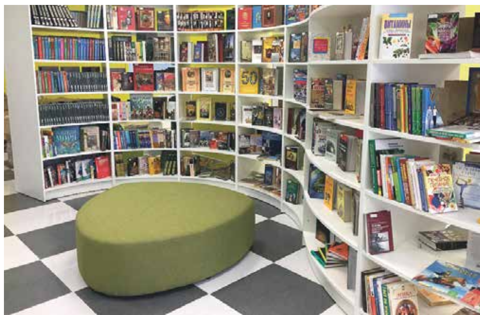
Обновленные помещения библиотечного центра «Маяк»

Популярное направление деятельности библиотек – краеведение. Одним из ярких событий года стала XV историко-краеведческая конфе-