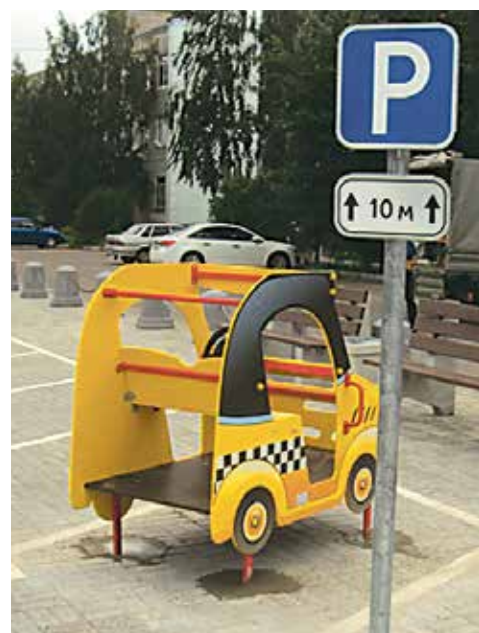
Детская площадка на ул. Геологическая

с перечнем, утвержденным Правительством Санкт-Петербурга.