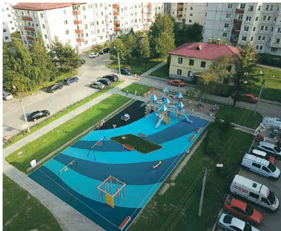
Новая детская площадка обустроена у дома 84, корп.8 на Петергофском шоссе

В МО Горелово и МО город Красное Село проведён текущий ремонт и содержание дорог, расположенных в пределах границ МО, в соответствии