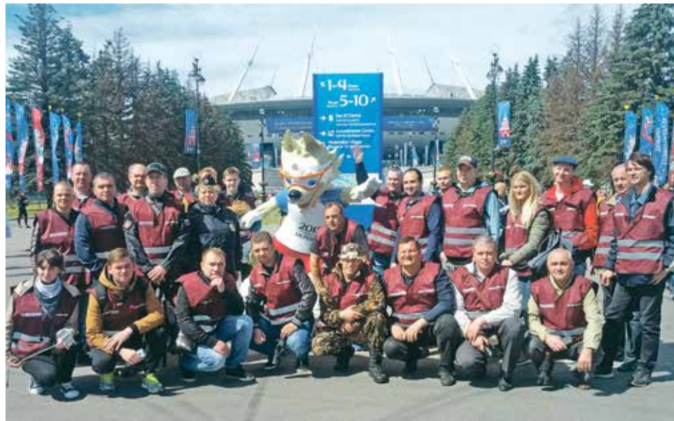
Народные дружинники Красносельского района охраняли общественный порядок на ЧМ-2018

В конце 2018 года численность дружинников в районе составила 367 человек. Дружинниками совместно с сотрудниками органов внутренних дел проверено 150 адресов проживания несовершеннолетних, состоящих на профилактическом