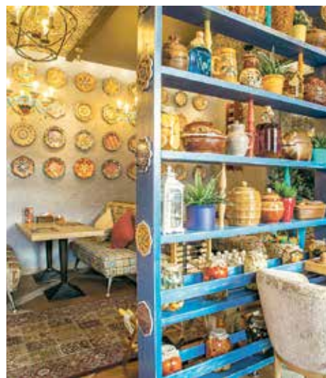
Ритейл продолжает развитие

Представители потребительского рынка района приняли участие в ежегодных конкурсах «Золотой Гермес», «Лучший по профессии» и «Золотая Кулина».