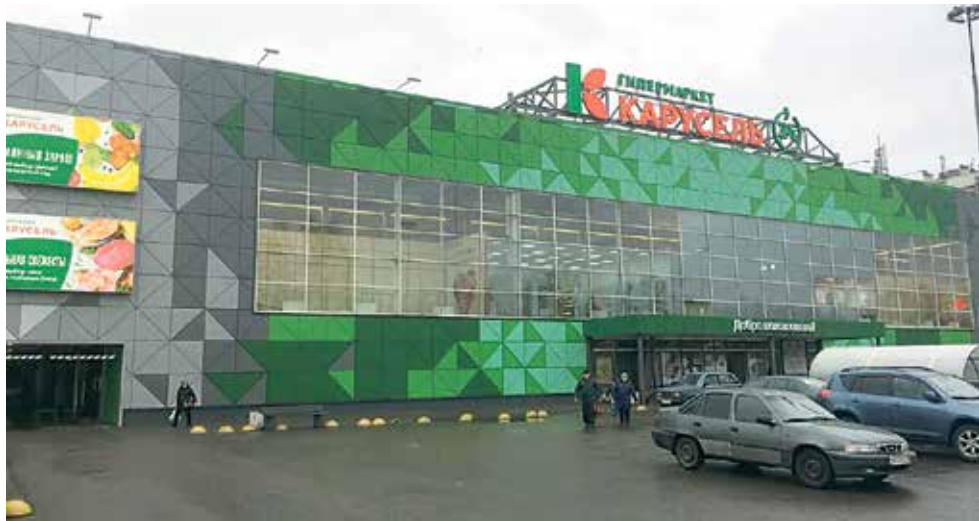
Гипермаркет «Карусель» (ул. Партизана Германа, д. 47) после ремонта

В 2018 году в районе было открыто около 80 предприятий потребительского рынка. Крупные торговые сети по-прежнему являются одним из самых успешных элементов потребительского рынка. Форматы гипер- и супермаркетов остаются наиболее востребованными населением.