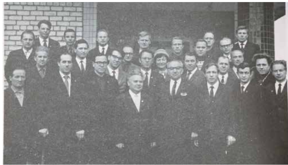
Коллектив разработчиков – сотрудников ВНИИтрансмаш