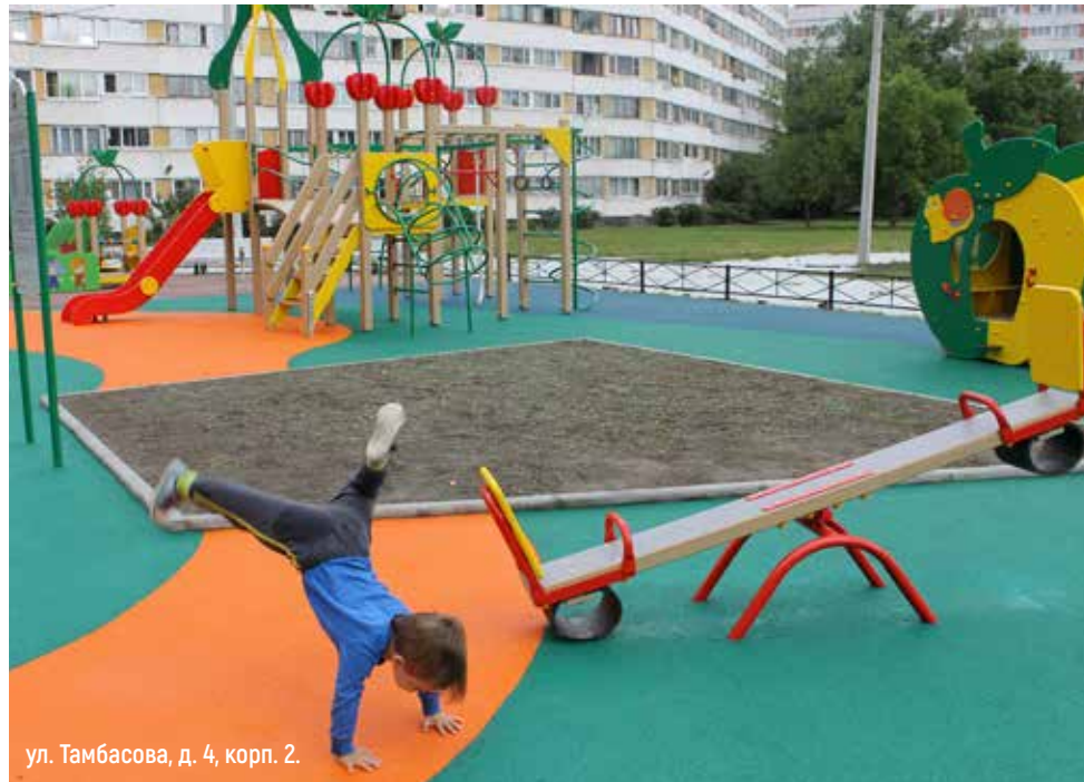
ул. Тамбасова, д. 4, корп. 2.

ВЛАСТЬ ПРОДОЛЖАЕТ ВОПЛОЩАТЬ НАКАЗЫ ЖИТЕЛЕЙ ПО СОЗДАНИЮ КОМФОРТНОЙ ГОРОДСКОЙ СРЕДЫ.