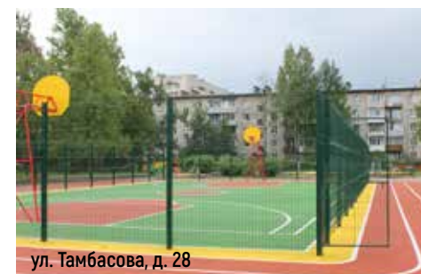
ул. Тамбасова, д. 28

Ч его не хватает во дворе дома для удобства жителей, где необходимо уложить свежий асфальт, куда лучше поставить новые скамейки, а где стоит разбить сквер? Ответы на эти и другие вопросы горожане высказали в рамках проекта «Наш район – нам решать». Задачи горожане поставили – власть засучила рукава. В июльском номере наша газета рассказала о стройках, которые развернулись в Красносельском районе по народному наказу.