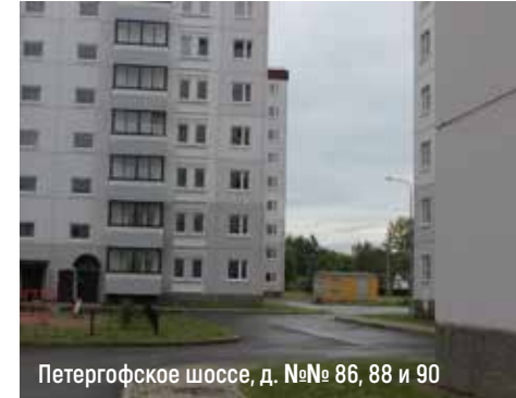
Петергофское шоссе, д. №№ 86, 88 и 90