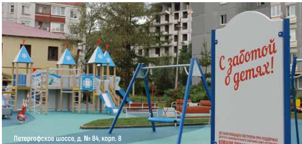
Петергофское шоссе, д. № 84, корп. 8