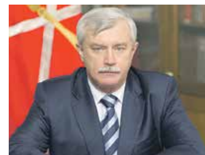
Губернатор Санкт-Петербурга Георгий Полтавченко:

– Горожанами было подано 645 тысяч конкретных предложений по улучшению городского пространства. Там были готовые проекты для «Умного города». Например, создание сервиса оперативного поиска потерявшегося ребенка через Городской центр видеонаблюдения. Районные администрации их проанализировали, обобщили и определили 300 самых популярных. Я поручил отраслевым комитетам и главам районных администраций скорректировать адресные и государственные программы с учетом поданных петербуржцами предложений.