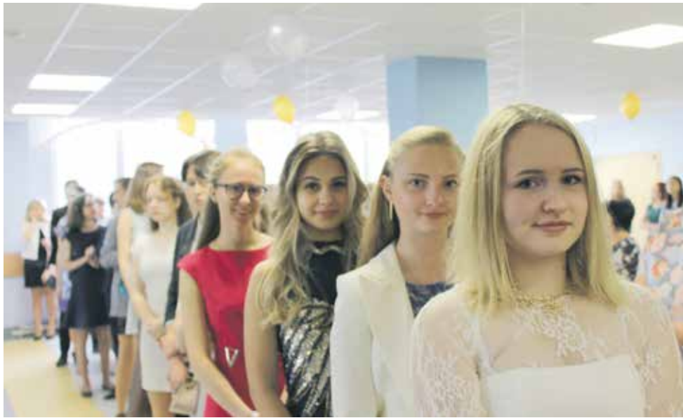
«Очередь» за золотыми медалями

ВЫПУСКНИКОВ КРАСНОСЕЛЬСКИХ ШКОЛ НАГРАДИЛИ ЗА ОСОБЫЕ УСПЕХИ В УЧЕБЕ.