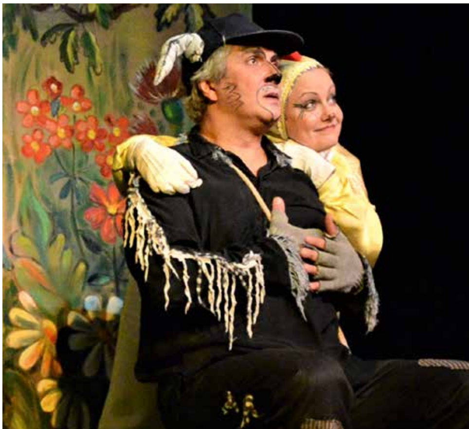
Сцены из спектаклей «Малыш и Карлсон», «Золотой цыпленок».