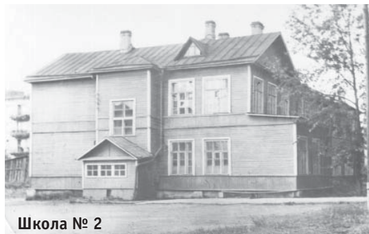
Школа № 2