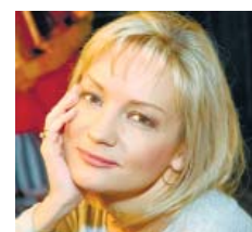
Татьяна Буланова, певица:

— У меня самой двое детей, второй еще маленький. Слава богу, что на свете есть детские врачи. И хорошо, что здесь, на портале НашЛюбимый-