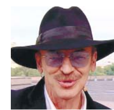
Михаил Боярский, артист:

Врач.рф, можно сказать им спасибо. Дорогие врачи, низкий вам поклон.