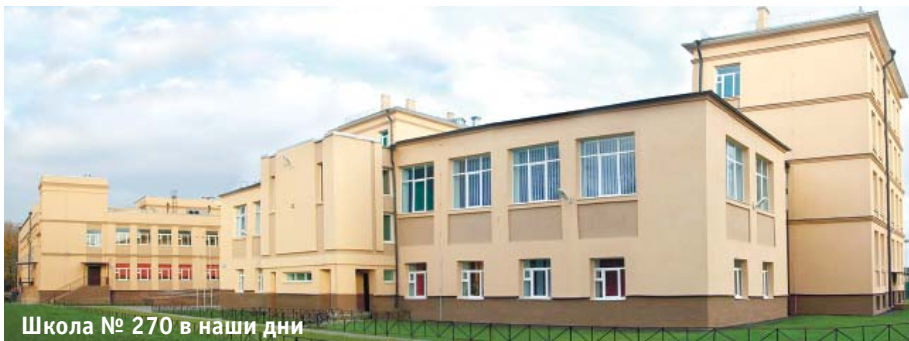
Школа № 270 в наши дни