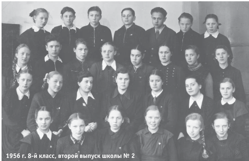
1956 г. 8-й класс, второй выпуск школы № 2