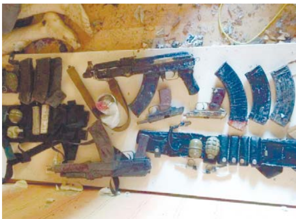
Оружие боевиков, обезвреженных 17 августа 2016 года на Ленинском проспекте

Напомним, год назад, 17 августа 2016 года, ФСБ в ходе спецоперации обезвредила в Красносельском районе группу