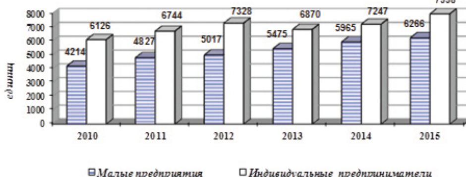
Динамика малых предприятий и индивидуальных предпринимателей по Красносельскому району в 2010-2015 годах

№ МП-сп «Сведения об основных показателях деятельности малого предприятия» (заполненный отчет по этой форме представляется по месту регистрации малыми (микро) предприятиями в районный отдел государственной статистики по адресу: 198329, СПб, ул. Партизана Германа, д. 3, каб. № 621, тел. 736-86-18);