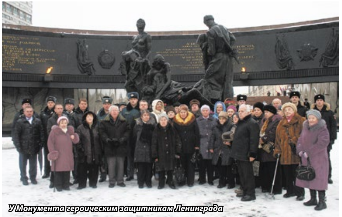
У Монумента героическим защитникам Ленинграда