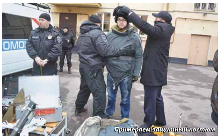
Примеряем защитный костюм