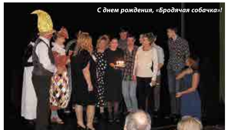
С днем рождения, «Бродячая собачка»!