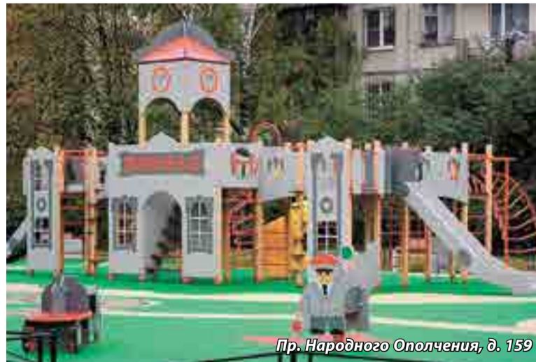
Пр. Народного Ополчения, д. 159

В городском смотре-конкурсе на лучшее комплексное благоустройство Кировский район занял третье место.