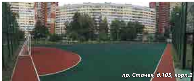
пр. Стачек, д.105, корп.2