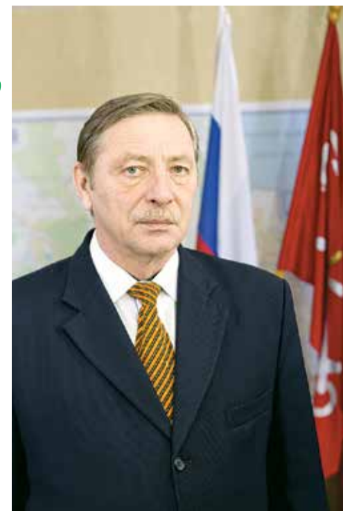
Уважаемые жители Красносельского района!

Ушедший год стал еще одним завершающим этапом становления местного самоуправления в Санкт-Петербурге, ведь 14 сентября 2014 года мы избрали депутатов муниципальных советов пятого созыва. Жители района выбрали тех депутатов, которые настроены на работу, на конструктивное сотрудничество с органами исполнительной государственной власти, и это – главный итог. В подавляющем большинстве мы выбрали депутатов, которые пришли во власть не ради собственных амбиций, а для того, чтобы делать общее дело.