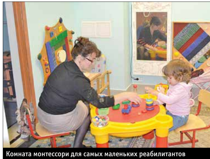
Комната монессори для самых маленьких реабилитантов

Для предоставления гражданам гарантированных социальных и реабилитационных