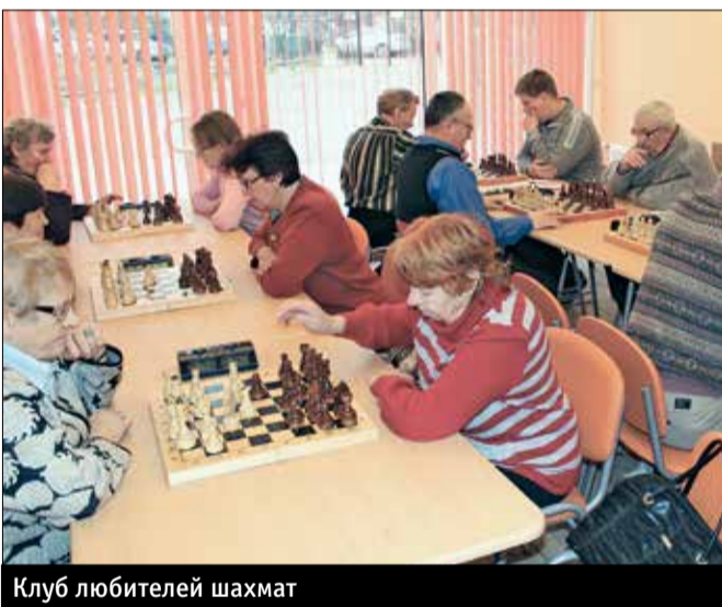
Клуб любителей шахмат

ского района Санкт-Петербурга», который расположен по адресу: пр. Героев, 24, корп. 2, оказывает широкий спектр услуг по социально-психологической, социально-педагогической, физкультурно-оздоровительной, профориентационной и социокультурной реабилитации детям-инвалидам и инвалидам трудоспособного возраста. В структуре ГБУ «ЦСРИДИ» работают 11 отделений социально-реабилитационной направленности. Центр постоянно развивает новые направления и формы реабилитационной работы.