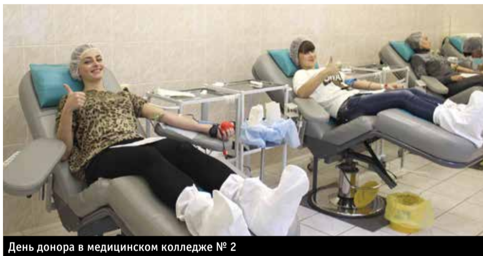
День донора в медицинском колледже № 2

Медицинский колледж № 2 проводит подготовку молодых квалифицированных специалистов для работы в учреждениях здравоохранения.