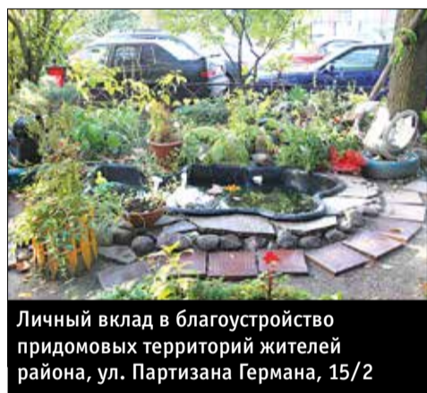
Личный вклад в благоустройство придомовых территорий жителей района, ул. Партизана Германа, 15/2