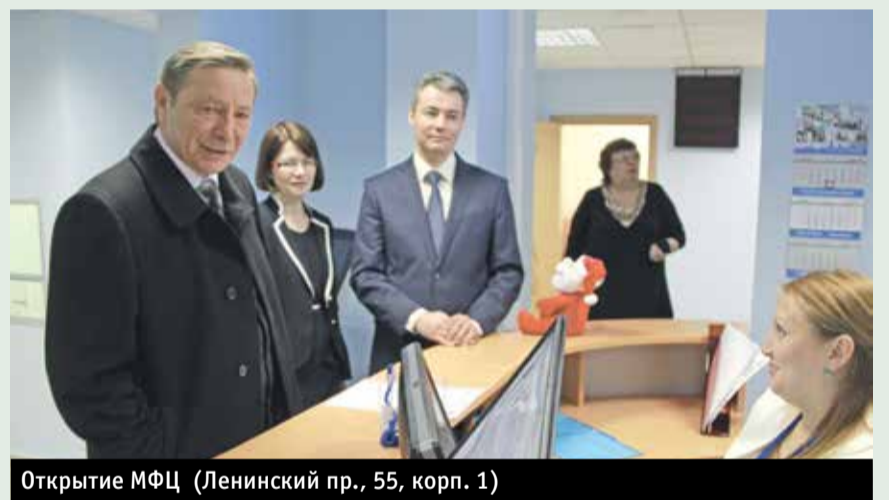
Открытие МФЦ (Ленинский пр., 55, корп. 1)

В декабре 2014 года на территории Красносельского района открыты 2 новых сектора Многофункционального центра предоставления государственных и муниципальных услуг, расположенных по пр. Ветеранов, 147, и Ленинский пр., 55, корп. 1. Поэтому сегодня жители района могут воспользоваться услугами четырех МФЦ. А в микрорайонах, удаленных от стационарных МФЦ, работают два мобильных МФЦ.