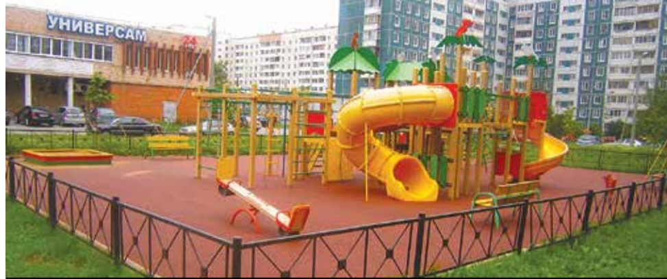
Благоустройство дворовой территории, ул. Коммунаров, 120

Силами ПМЦ «Лигово» и поисковых отрядов частично восстановлена линия окопов в Полежаевском парке. По государственному контракту выполнен ремонт трех памятников Мемориала в память обороны города в 1941–1944 годах «Зеленый пояс Славы», расположенных по адресам: Петергофское шос., 14-й