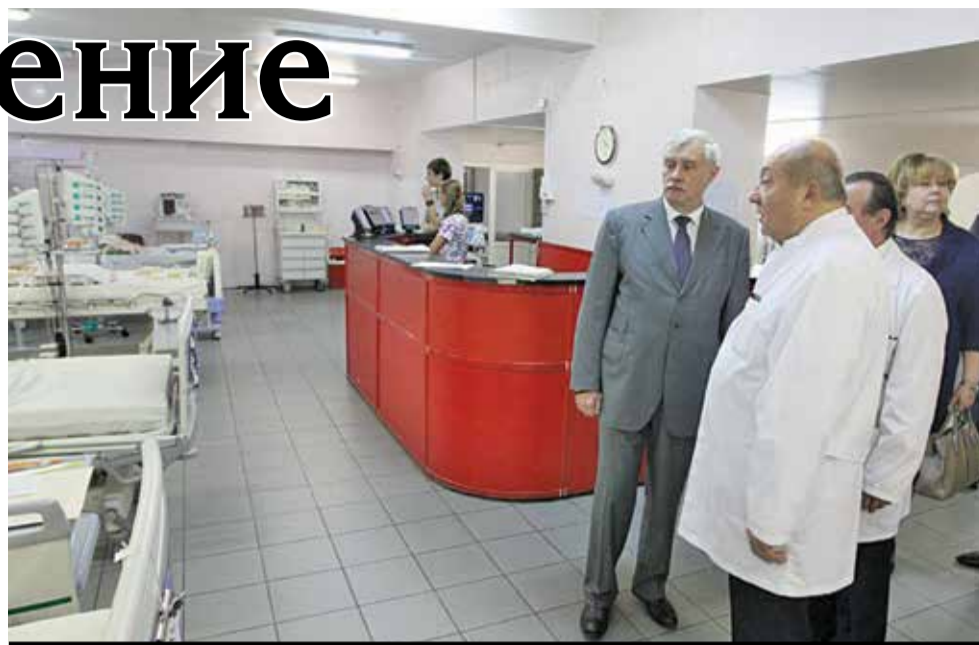
Открытие отделения интенсивной терапии в детской больнице № 1

В 2014 году велась работа по контракту на капитальный ремонт детского поликлинического отделения № 65. В Городской поликлинике № 93 проведен ремонт системы