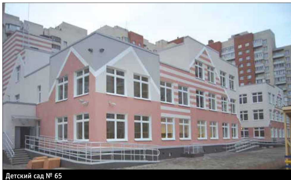
Детский сад № 65