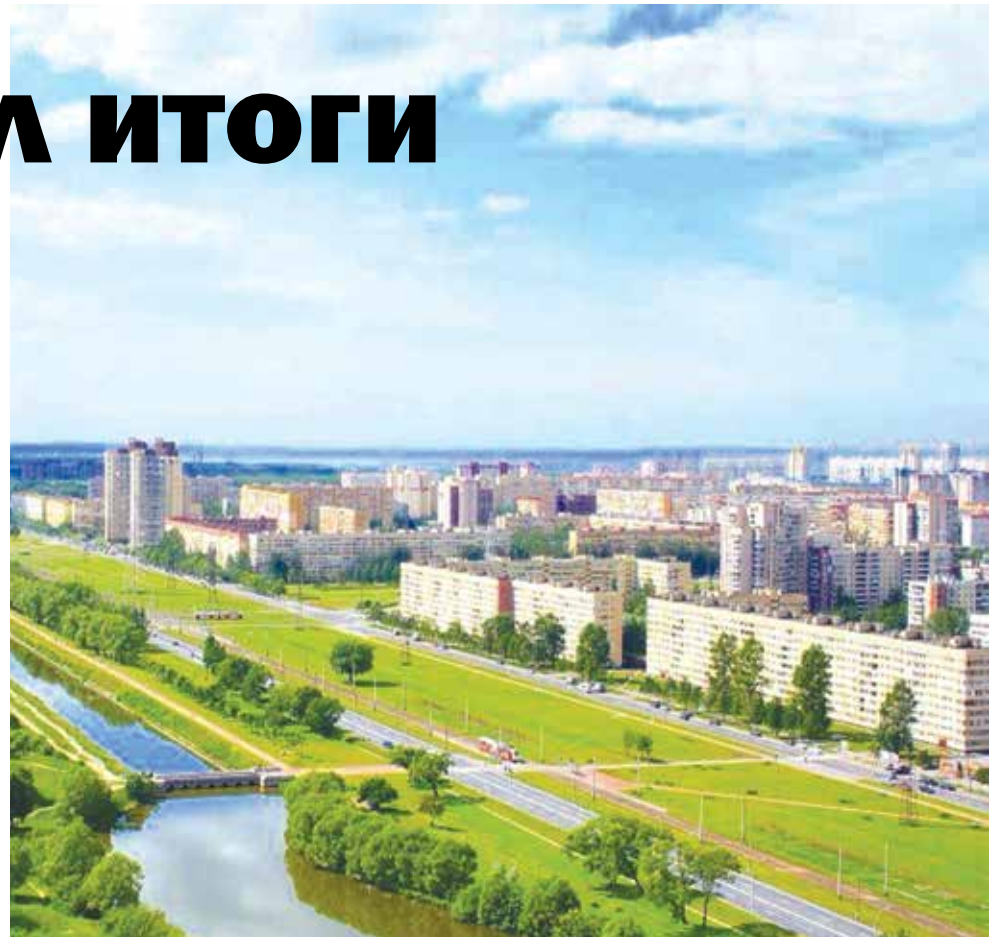
Фото «Красносельский район. Эко-взгляд» Бабенко Сергей

Среди старших классов лучшей работой стал видеofilm, созданный пятиклассницей школы № 242 Дарьей Ключниковой.