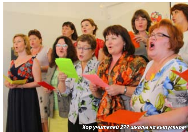
Хор учителей 277 школы на выпускном