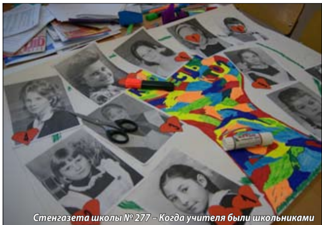
Стенгазета школы № 277 – Когда учителя были школьниками