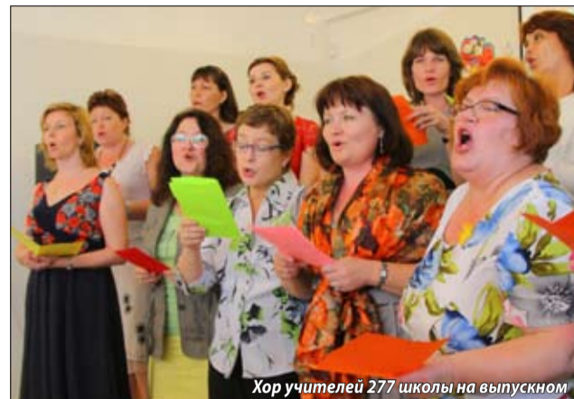
Хор учителей 277 школы на выпускном