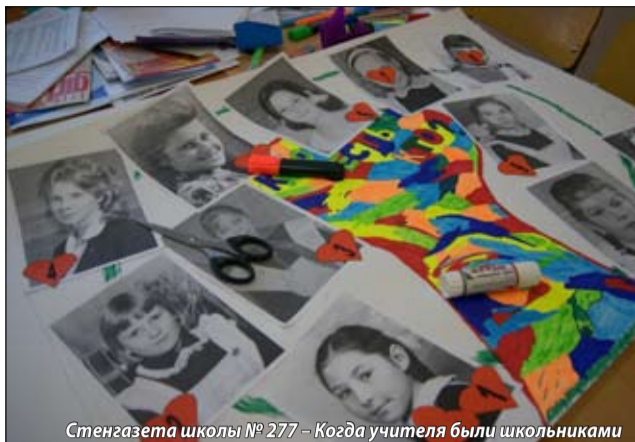
Стенгазета школы № 277 – Когда учителя были школьниками