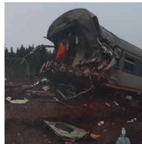
До 20 октября в кинотеатре «Восход» открыта фотовыставка по профилактике терроризма и экстремизма «Тактика уничтожения жизни – террор»

Если вы обладаете любой информацией о совершенных или готовящихся терактах или если заметили подозрительных лиц или опасные предметы, просьба обращаться: в ФСБ России по телефонам: (495) 224-22-22, (495) 914-43-69 (круглосуточно) или отправить электронное сообщение по адресу: fsb@fsb.ru , в ГУВД по Санкт-Петербургу и Ленинградской области по телефонам: 573-21-81, 573-21-84, 573-23-09 , в УВД по Красносельскому району по телефонам: 736-96-55, 736-02-75.