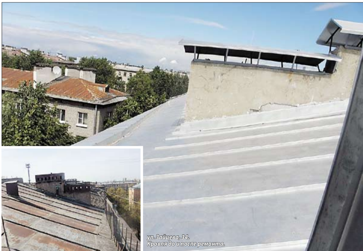
ул. Зайцева, 34. Кровля до и после ремонта.