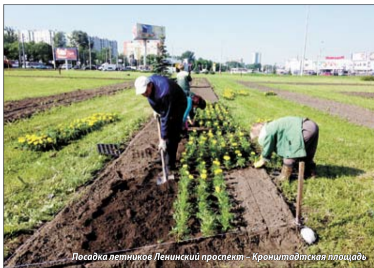
Посадка летников Ленинский проспект – Кронштадтская площадь

Все работы в садово-парковом предприятии «Нарвское» распределены по пяти участкам. Производится косьба газонов, уборка территории, вывоз мусора, прополка земли, стрижка «живой» изгороди, валка старых деревьев.