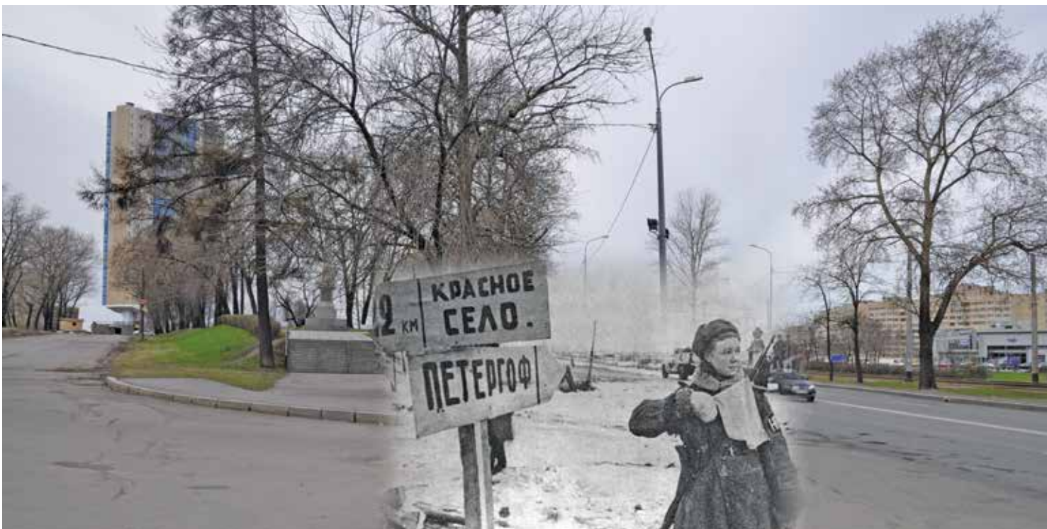
Ленинград 1944–2012. Регулировщица у развилки дорог на Красное Село и Петергоф