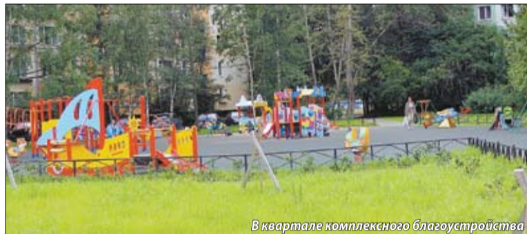
В квартале комплексного благоустройства

В 2013 году выполнены работы по комплексному благоустройству квартала, на Дачном проспекте у школы №274 на сумму 19,2 млн. руб.