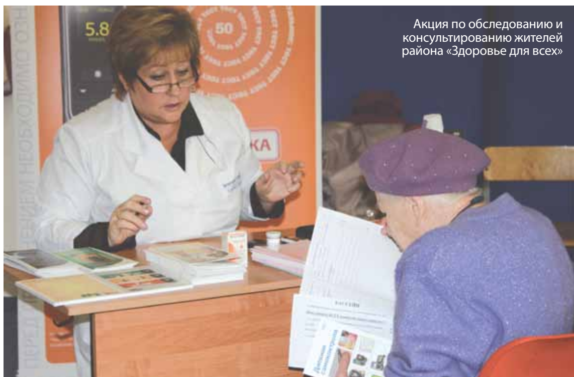
Акция по обследованию и консультированию жителей района «Здоровье для всех»

В соответствии с указом Президента РФ и «дорожной картой», утвержденной постановлением правительства Петербурга, была увеличена заработная плата в сфере здравоохранения. У врачей она должна была составить 47 400 рублей, у медсестер — 29 200 рублей, у младшего персонала 17 000 рублей. В этом году мы очень плотно занимались этой проблемой. Для учреждений, финансируемых