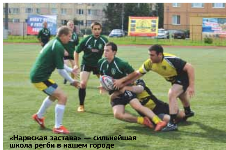
«Нарвская застава» — сильнейшая школа регби в нашем городе

Началом регби в Ленинграде принято считать 1962 год. Тогда состоялись первые официальные турниры и была организована Федерация регби Ленинграда. Сейчас центром развития регби в нашем городе по праву считается Кировский район. В 1995 году был