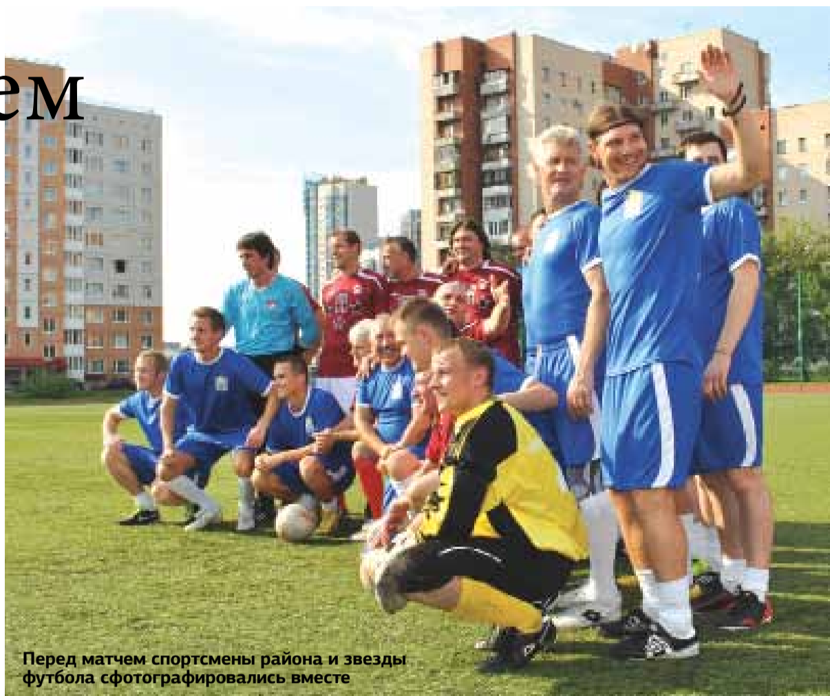
Перед матчем спортсмены района и звезды футбола сфотографировались вместе