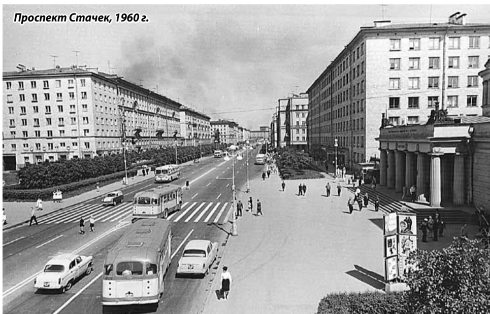
Проспект Стачек, 1960 г.

на Московский и Нарвский. А 30 октября того же года в черту Ленинграда были включены несколько населённых пунктов Пригородного района, в том числе и Вологодско-Ямская слобода присоединена к Нарвскому району.