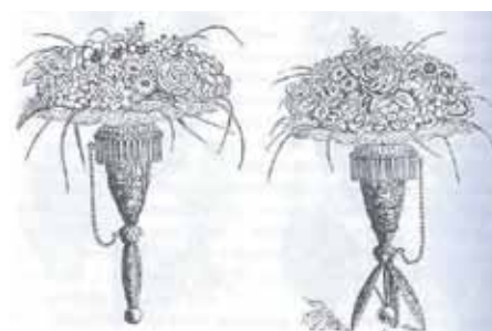
Портбукет с закрытой и раскрытой ручкой (в раскрытом виде он превращался в миниатюрный цветочный столик). Середина XIX в.

А перед многоэтажными домами на газонах можно встретить старинные французские розы, которые мы называем шиповниками. Они перекочевали из дворянских усадеб в палисадники частных домов и оттуда уже под окна городских квартир.