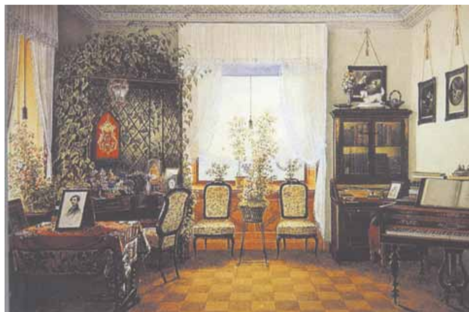
Э. Гау. Девичья комната великой княжны Александры Николаевны в Коттедже

К середине XIX века входит в моду украшение столов живыми цветами. И, конечно же, купечество не упускает момента заработать на этом товаре. За Нарвской заставой купцы Ушаковы, владевшие землей, занятой огородами и парниками, занялись