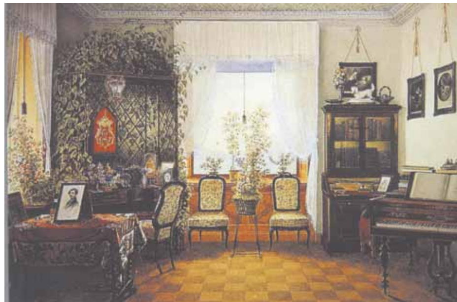
Э. Гау. Девичья комната великой княжны Александры Николаевны в Коттедже