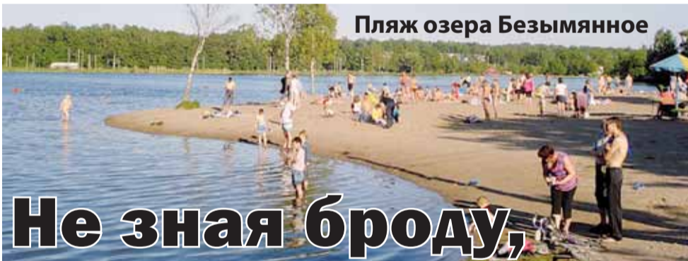
Пляж озера Безымянное